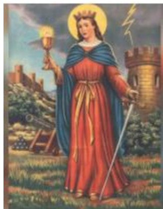
Sv. Barbara, 4. prosinca