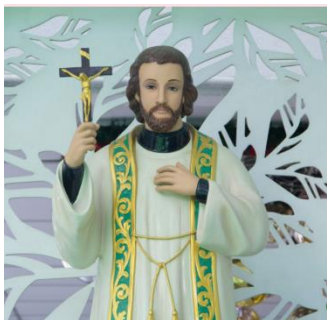
Sv. Franjo Ksaverski, 3. prosinca