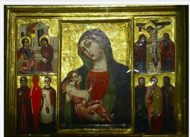
Čudotvorna slika Gospe Trsatske. Izvornik koji se čuva u riznici trsatskoga samostana.